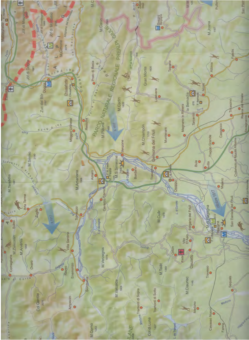
Zona di guerra in cui l'autore fu preso prigioniero il 6 novembre 1917