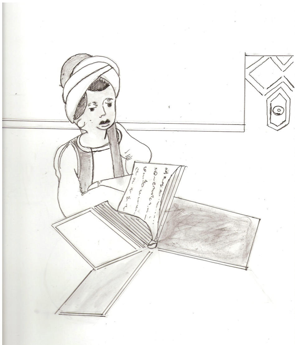
Lettura del Corano

la mia vita, il mio destino non sono legati a questa terra, voglio viaggiare, vedere Paesi nuovi, quelli che mi mostra il maestro sulle carte, sono attraenti per i colori, ma non mi danno alcuna emozione... e poi voglio conoscere cosa nasconde nelle sue profondità questo splendido mare, non so come sarà possibile, ma ne sono certo, un giorno tutto questo si avvererà, allora, solo allora mi vedrete sorridere.