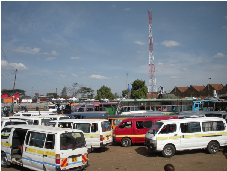
Il "nido dei matatus", davanti alla stazione ferroviaria di Nairobi.