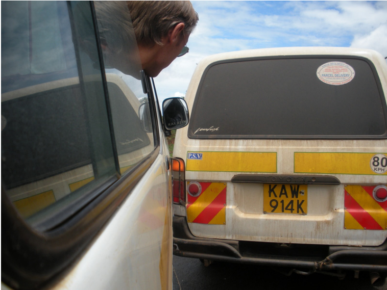
Antoine, compagno di viaggio, controlla al primo tamponamento come stia il nostro matatu.