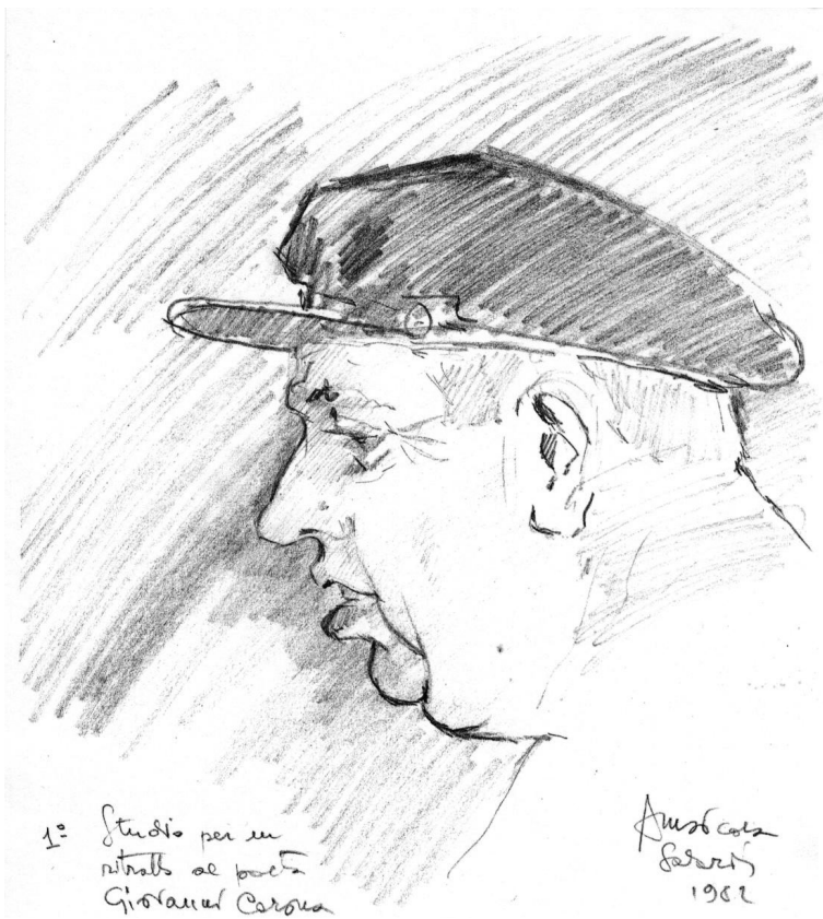
Primo Studio per un ritratto al poeta Giovanni Corona

S'Archittu, estate 1982 Amsicora Salaris